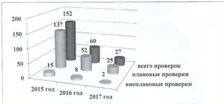
Рис. 2. Динамика изменения количества проверок в отношении лицензиатов с 2015 по 2017 гг.

Динамика изменения количества проверок в отношении лицензиатов за последние 3 года представлена на рисунке 2.